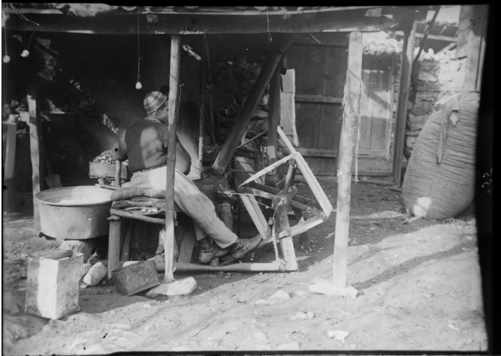
ბალდადური თეთრი ჯიშის პარკიდან ძაფის ამოხვევა ადგილობრივ დაზგაზე/ Reeling a thread from the cocoons of Bagdad White species on a local loom