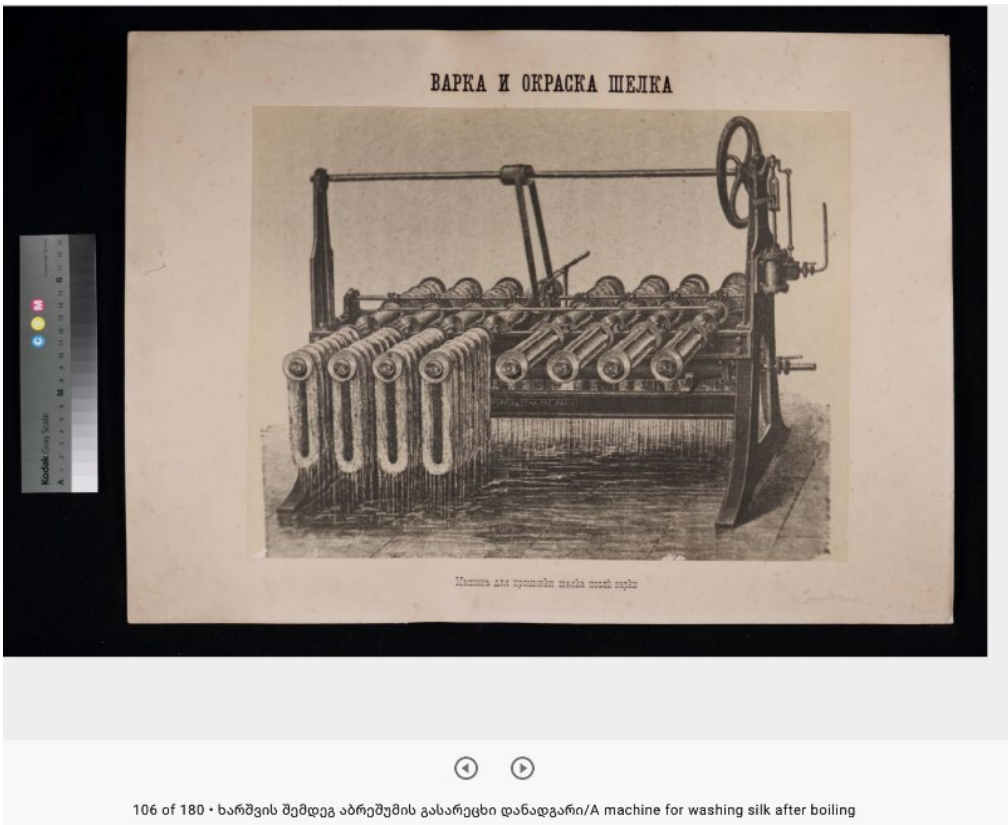
106 of 180 • ხარშვის შემდეგ აბრეშუმის გასარეცხი დანადგარი/A machine for washing silk after boiling ხარშვის შემდეგ აბრეშუმის გასარეცხი დანადგარი